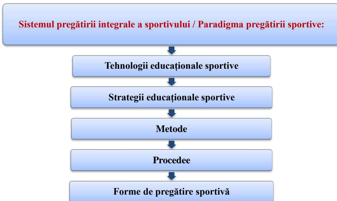
Fig. 7.1. Sistemul pregătirii integrale a sportivului/Paradigma pregătirii sportive

În acest context rolul formatorului este de a organiza, structura, ghida activitatea formabilului, oferindu-i puncte de sprijin după necesitate, privind: