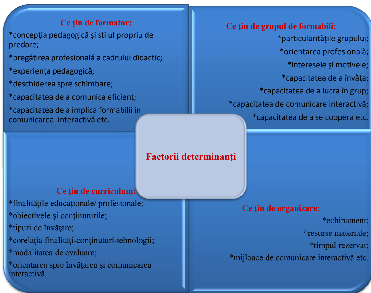
Fig. 7.2. Factorii ce stau la baza proiectării strategiei didactice interactive

Factorii ce stau la baza proiectării strategiilor didactice interactive. Proiectarea strategiilor didactice depinde și de un sistem de factori (Figura 7.2) ce țin de: cadrul didactic/formator, grupul de formabili, tehnologia abordată, curriculum, organizare a învățământului și resursele materiale/instrumentale: