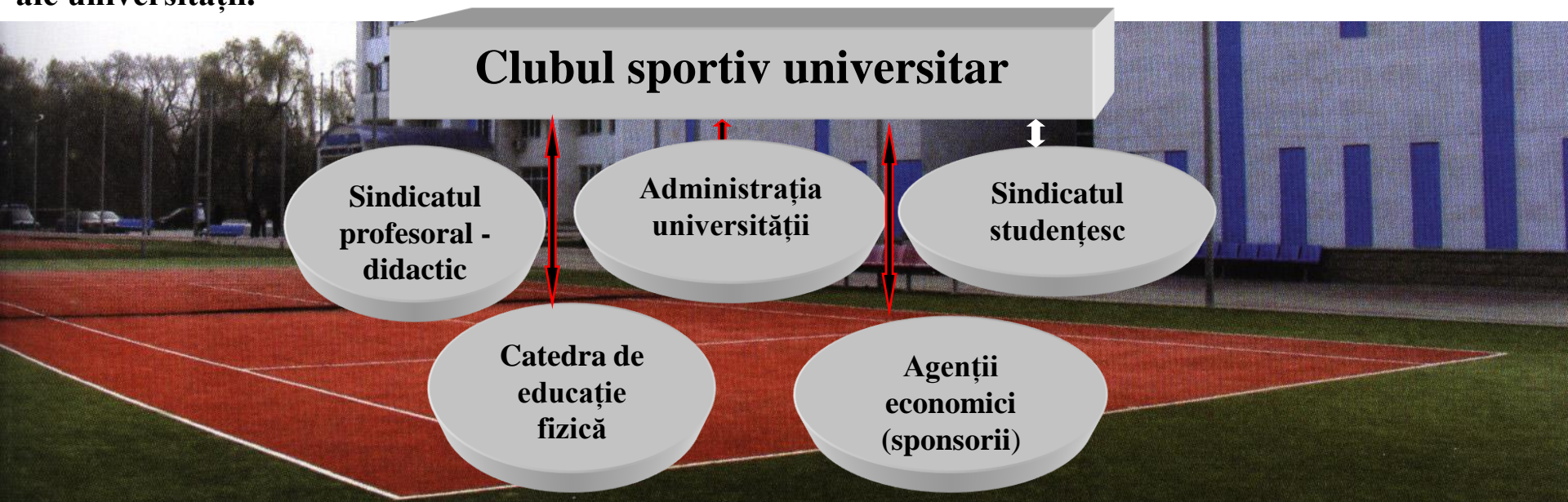
Fig.22.2. Organigrama de activitate a clubului sportiv universitar

Cluburile sportive sunt structuri sportive cu personalitate juridică. Pentru participare la competițiile sportive naționale și internaționale, cluburile urmează să se afilieze la federația națională corespunzătoare. În fig.22.2. se reflectă interacțiunea clubului sportiv studentesc cu diferite structuri ale universității.